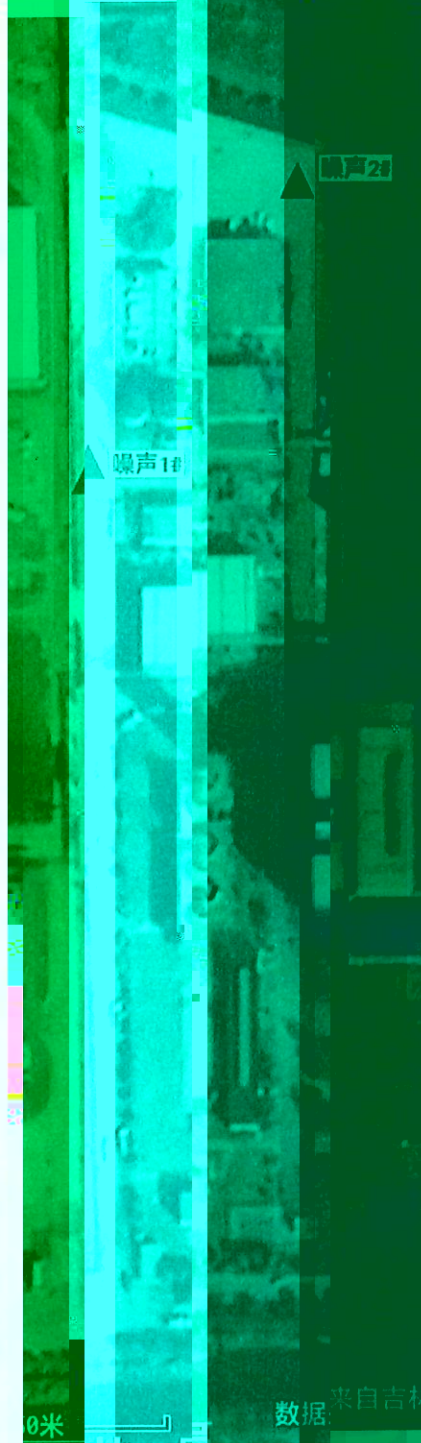
图 1 监测点位示意图